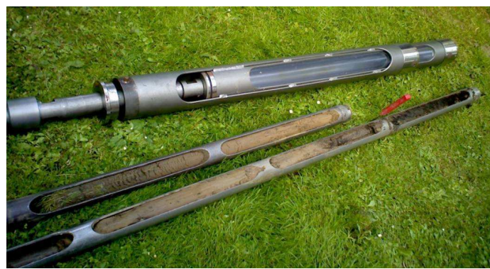
Obr. 2) okénkové jádrovky, GB PPL s PE trubicí