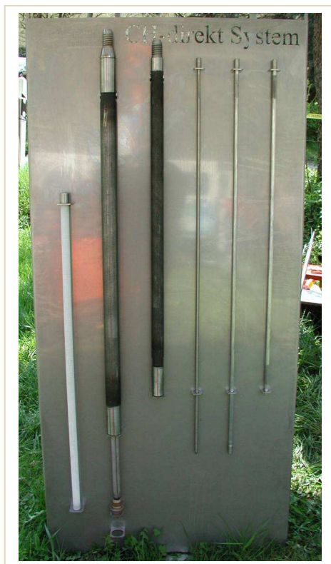
Obr. 1) CH-direkt System (direct push)